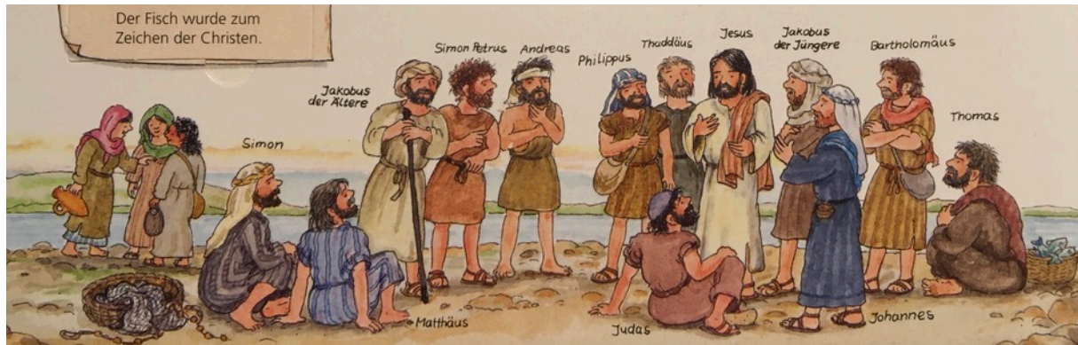
Bild entnommen aus: Erne, A.: Wieso, Weshalb, Warum? Wir entdecken die Bibel (2017). Ravensburger Buchverlag Otto Maier GmbH. S. 13

https://www.youtube.com/watch?v=qZzMzIgyFgE